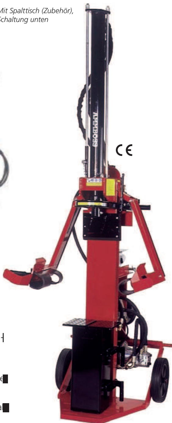
Abb.: Mit Spalttisch (Zubehör), Schaltung unten