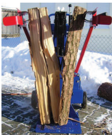
Abb.: H95 beim Meterholzspalten